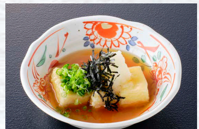
和風餡かけの揚げ豆腐