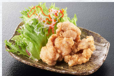
瀬戸内森林鶏白だし唐揚げ