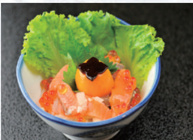
サーモンといくらの塩麴ユッケ ~濃厚玉子のせ~