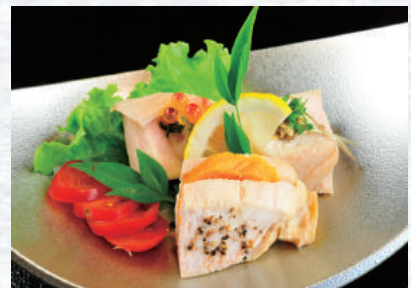
森林地鶏の低温仕込み3種盛り