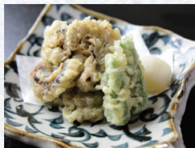
瀬戸内産 やわらか煮蛸の天婦羅