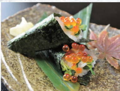
海鮮姫手巻き寿司