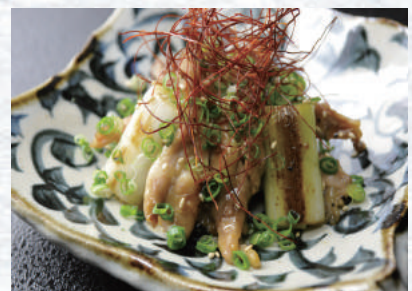
せせりと白葱の塩だれ炒め